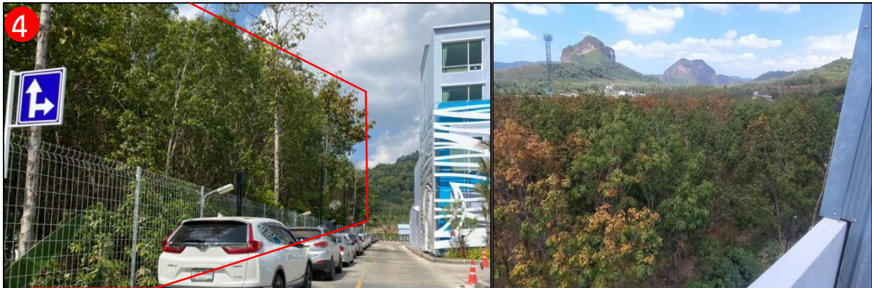
ทิศตะวันตก ติดกับสวนยางพารา ซึ่งเป็นที่ดินของโรงพยาบาล