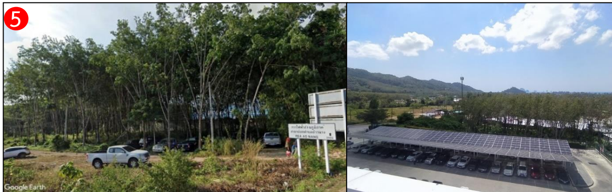
ทิศใต้ ติดกับ ที่ดินบุคคลอื่น ปัจจุบันเป็นสวนยางพารา